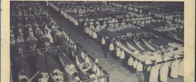
Reclutas de las flotas y las fábricas de la Nación se inician en un centro naval cerca de Chicago. Aquí los vemos durmiendo en hamacas.

de los alistados han cursado la segunda enseñanza y están bien preparados para aprender los diversos oficios que una escuadra moderna necesita en la línea de batalla. Muchos de ellos accedieron, a pesar de que los oficiales son siempre graduados de la famosa Academia de Annapolis, donde también se preparan muchos oficiales de las armadas de Hispano América.