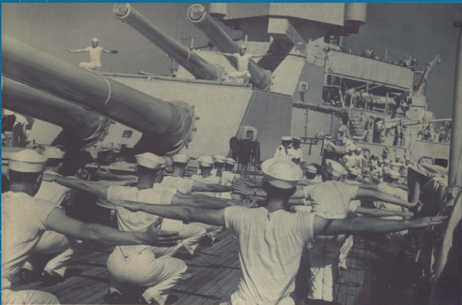
La tripulación de un acorazado hace ejercicios diariamente. La Armada sólo admite hombres en perfectas condiciones físicas.