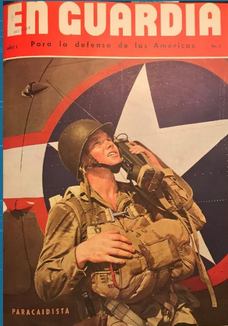
Year 3, No. 3 (1943)